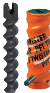
Klimasan - Dämmputzwendel